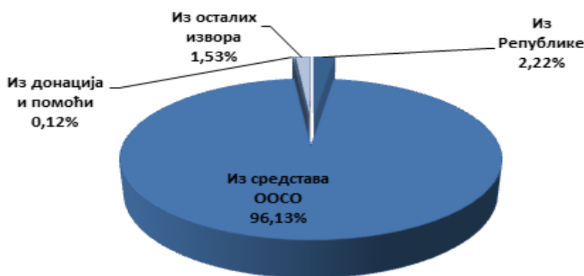
Слика број 1. Приказ остварених текућих прихода и примања по изворима финансирања у 2021. години (у хиљадама динара)

Највећи део текућих прихода УКЦ Ниш у 2021. години остварен је из средстава ООСО (96%).